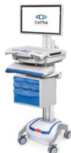
M38e Medicatielades (4-laags)