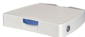
7,5 cm lade

Flexibiliteit om werkstation te configureren met opbergladen in 7,5 of 15 cm hoogte