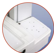
Barcodescanner planken en scannerhouder opties