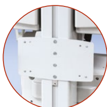
Beugel voor infectie-controladoekjes