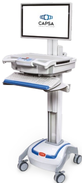
M38e Document Model

De M38e van Capsa Healthcare is een van de meest beproefde point-of-care computerrolleys in de gezondheidszorg. Met bijgewerkte functies die zorgen voor: superieure ergonomie, geoptimaliseerd gebruiksgemak en uitgebreide opslagflexibiliteit. De M38e maximaliseert klinische efficiëntie en verhoogt de prestaties van uw healthcare-IT producten.