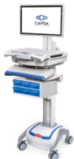
M38e Medicatielades (2-laags)

Flexibiliteit om werkstation te configureren met opberglades of bakken. Ook verkrijgbaar met elektronisch slot.