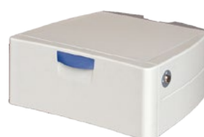
15 cm lade