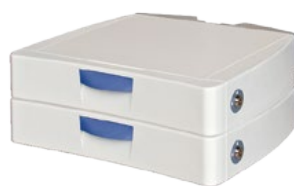
Twee 7,5 cm lades