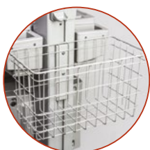
Draadmand (Standaard of extra groot)