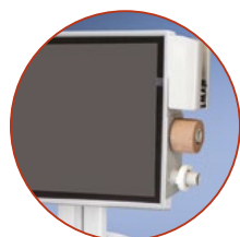
Access Pack voor medcups, tape en alcoholdoekjes en/of scannerhouder