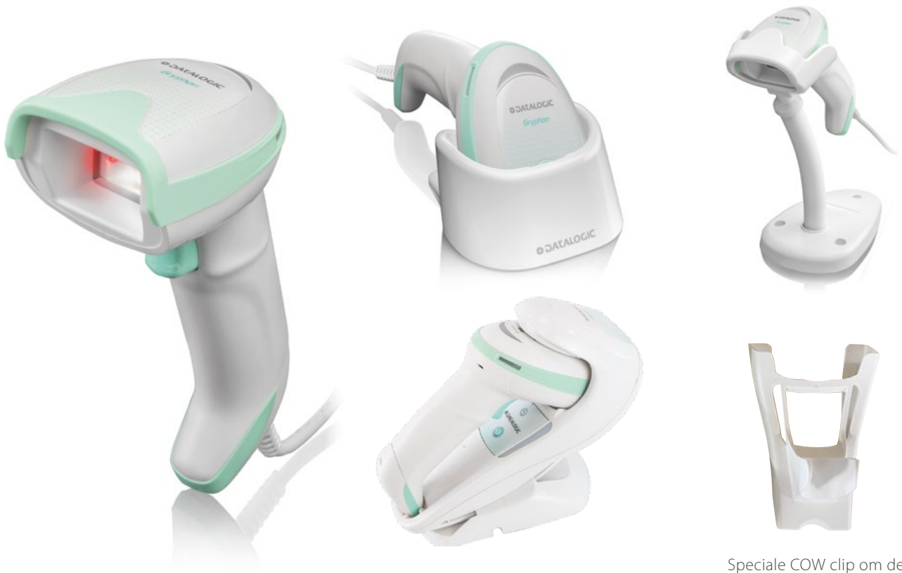
Speciale COW clip om de scanner in vast te hangen.