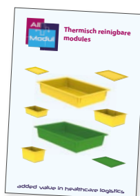
Thermisch reinigbare modules